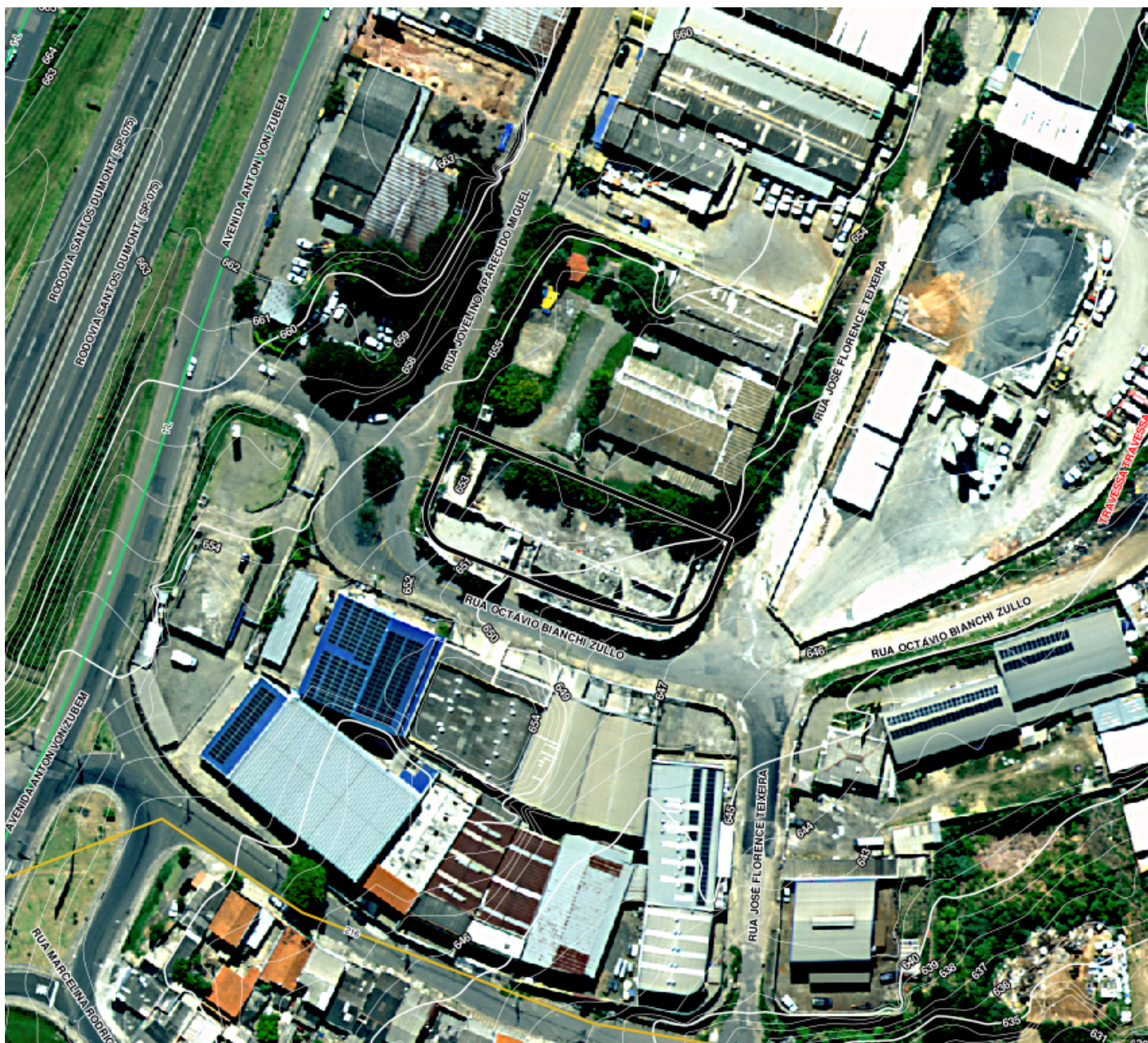
Ortofoto IGC Abr/2023 - Situação sem escala